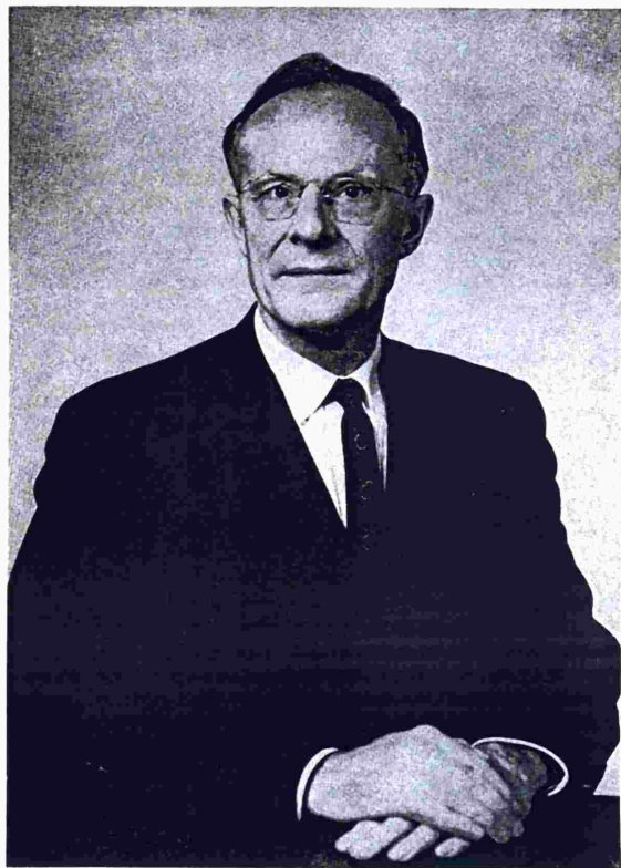
Theodore W. Schultz