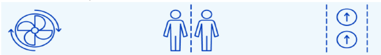
Asigurarea ventilației/ montarea de filtre

Măsuri tehnice: Aceste tipuri de controale reduc expunerea la pericole fără a se baza pe comportamentul lucrătorilor și pot fi cele mai rentabile soluții de pus în aplicare. Controalele tehnice includ, de exemplu: îmbunătățirea ventilației; instalarea barierelor fizice, ar fi apărătoarele din plastic transparent; instalarea unei ferestre drive-through pentru serviciul clienți.