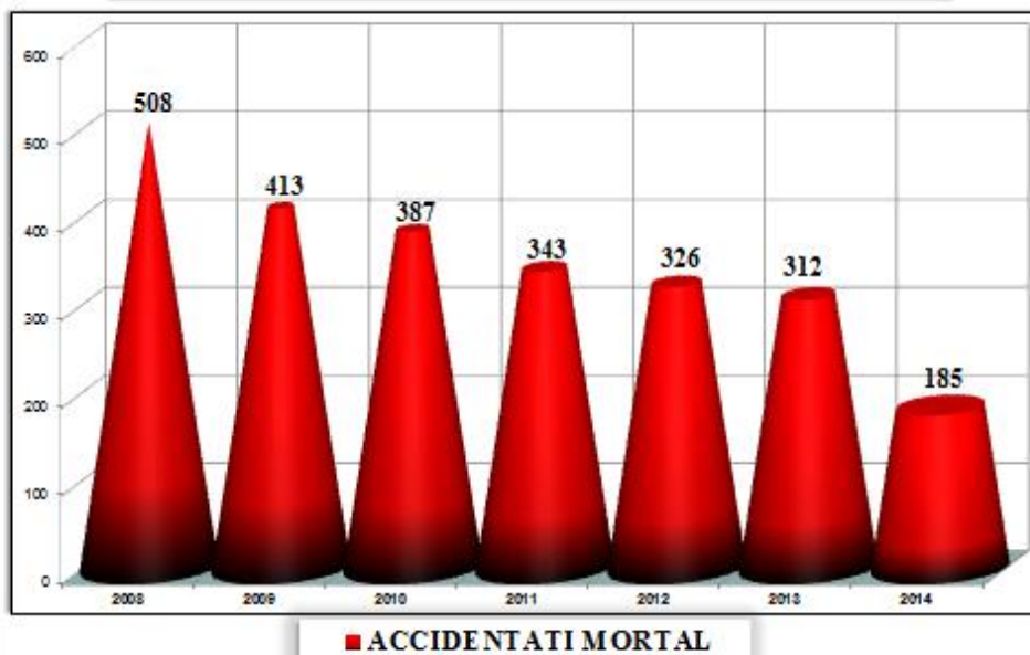
EVOLUȚIA ACCIDENTAȚILOR MORTAL ÎN MUNCĂ PE ANI DE PRODUCERE